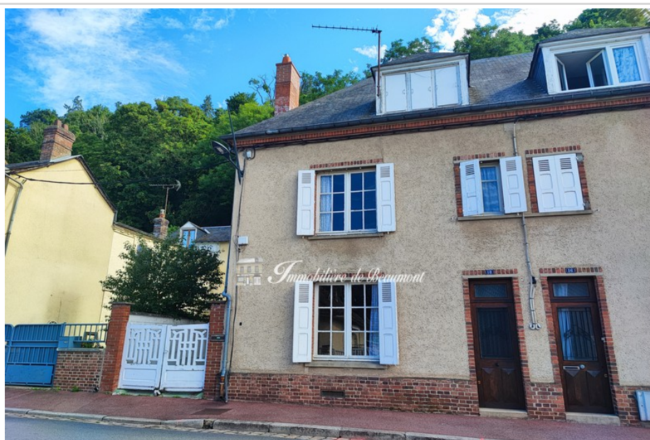
Maison 463 Beaumont-le-Roger

L'Immobilière de Beaumont vous propose de découvrir cette maison de ville d'environ 130 m 2 située au coeur de BEAUMONT-LE-ROGER. Elle se compose : - Au rez-de-chaussée : d'une entrée -couloir desservant un salon, une salle à manger avec cheminée ouverte, une cuisine aménagée et un bureau ; - Au premier étage : trois chambres, une salle d'eau et un WC ; - Au deuxième étage : deux chambres et une pièce de stockage (grenier). Un sous-sol à usage de cave et chaufferie vient compléter cette maison. La maison dispose également d'une cour bétonnée dans laquelle on y retrouve une cuisine d'été et un appenti ainsi qu'un garage. BEAUMONT LE ROGER est un bourg avec commerces, écoles, collèges, médecins, services et gare SNCF, le tout accessible à pieds. Les informations sur les risques auxquels ce bien est exposé sont disponibles sur le site Géorisques.